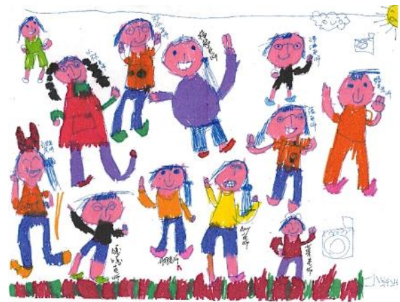
小米粉筆下的三民老師

接著進行校園巡禮、玩小偵探尋寶(畢業證書)遊戲、最後開始畢業典禮的重頭戲，唱畢業歌、領取畢業證書及各類獎項頒獎、畢業生致詞、等，深刻地感受到整體活動的心意，溫馨且感動，回憶歷歷在目讓許多家長熱淚盈眶，典禮在謝親恩與孩子們的歡聲笑語中圓滿結束，我們也收起悸動的心情，將帶著三民的愛和祝福與孩子一同迎向下一階段的挑戰。