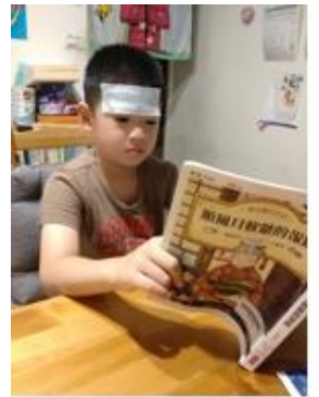
我在發燒的時候也會看書

我是三民幼兒園 37 屆的畢業校友，我想告訴今年畢業的學弟學妹關於上國小的一些事情和準備。每天早上要以快樂的心情進入學校，這樣上課時就可以專心學習，學得進去，下課時，就可以慢慢交到新朋友與熟悉新環境。