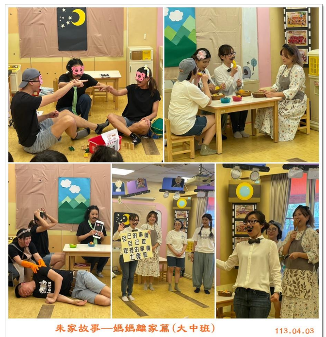
朱家故事—媽媽離家篇(大中班)